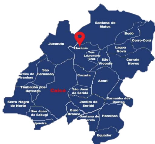
Figura 1 – Região do Seridó no Estado do Rio Grande do Norte